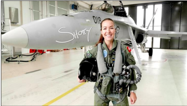
Fanny Chollet, première pilote militaire suisse de F/A-18 et l'ambassadrice du programme Swiss TECLADIES.